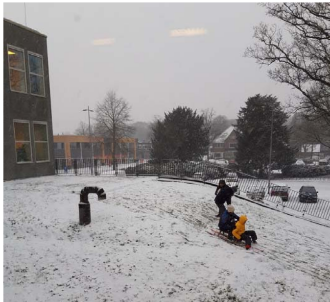
Onze helling is met sneeuw een dankbaar slee-object midden in het dorp

De brandmelders en brandblussers zijn in het verslagjaar gecontroleerd. De pomp voor eventueel overtollig water is maandelijks getest.