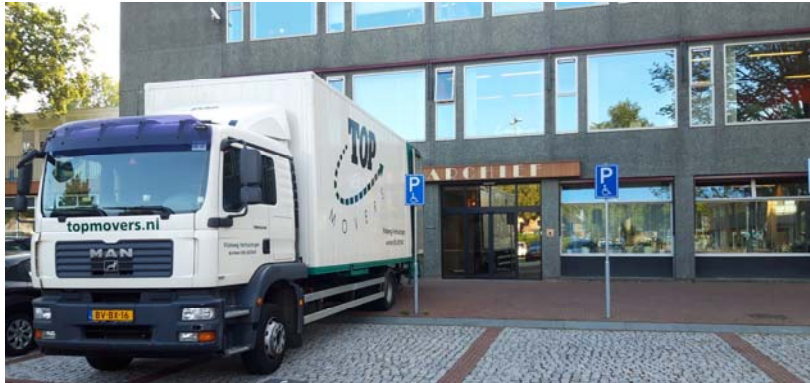
De archieven van de provincie worden opgehaald. Er waren drie van dit soort vrachtwagens voor nodig.

semi-statisch archief een plek te geven. Dat levert een substantieel bedrag aan huurpenningen op. Eind van het jaar werden facturen verstuurd tot een totaal van € 35.082. Dat is 23% van de totale begroting van het Streekarchief. Dit geld vloeit terug in de gemeentekassen en komt niet ten goede van het Streekarchief. De provincie is als huurder van 1000 strekkende meter planken in de loop van het jaar vertrokken.